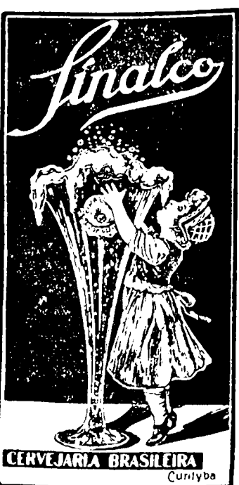
CERVEJARIA BRASILEIRA Curityba

CRYSTAL-SAGO ist in allen besseren Geschäften zu haben. Weitere Rezepte für Crystal-Sago-Speisen gratis per Post, versenden 1437 LORENZ & CIA. Blumenau - Estad. Sta. Catharina