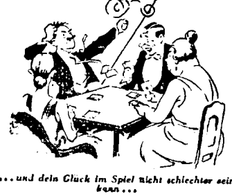
... und dein Glück im Spiel nicht schlechter sein kann ...