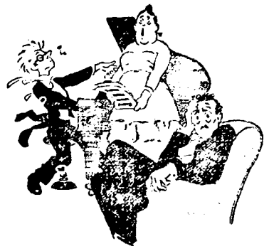
... und Musik und Gesang dir auf die Nerven gehen ...