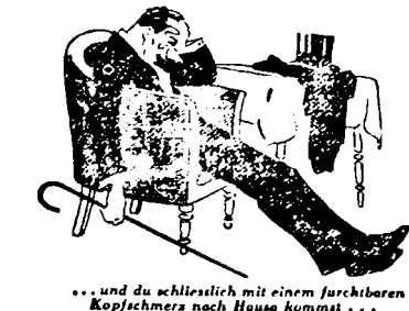
... und du schliesslich mit einem furchtbaren Kopfschmerz nach Hause kommst ...

... dann ist der Moment da, wo du das unfehlbare